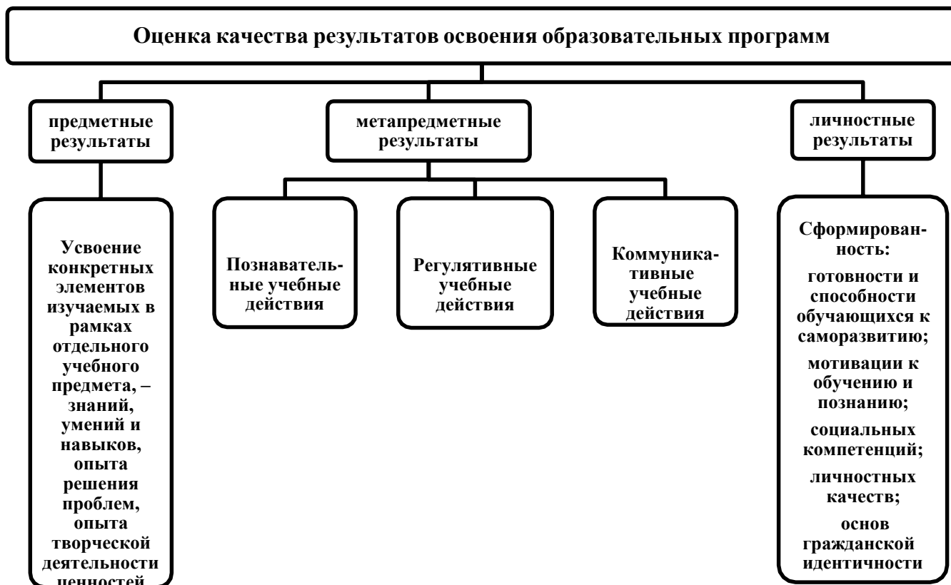
Рисунок 2. Содержательный компонент оценки качества результатов освоения образовательных программ.